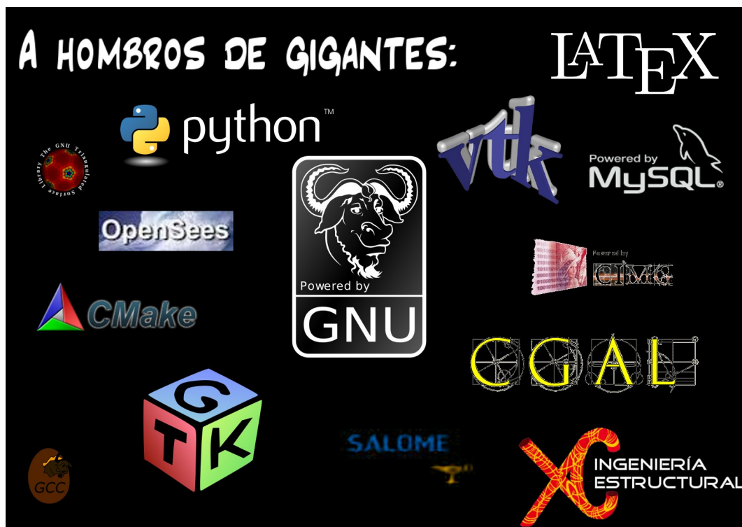
Figura 1: El desarrollo de XC se basa en otros paquetes de software libre muy reconocidos.